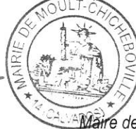
Coralie ARRUEGO Maire de Moul-Chicheboville

Le présent arrêté peut faire l'objet d'un recours pour excès de pouvoir dans un délai de 2 mois suivant sa notification, auprès du Tribunal administratif de Caen.