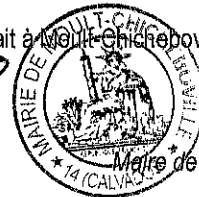
Coralie ARRUEGO Maire de Moul-Chicheboville

Le présent arrêté peut faire l'objet d'un recours pour excès de pouvoir dans un délai de 2 mois suivant sa notification, auprès du Tribunal administratif de Caen.